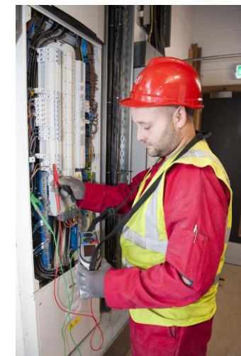
Forth Electrical Services poniendo en marcha un tablero de distribución Terasaki Pro-DB en el Estadio